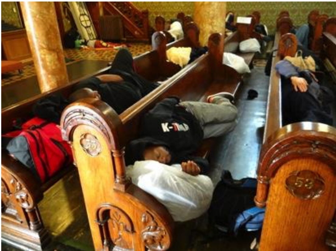
Daklozen liggen te slapen in de banken van de Saint Boniface Catholic Church in San Francisco.